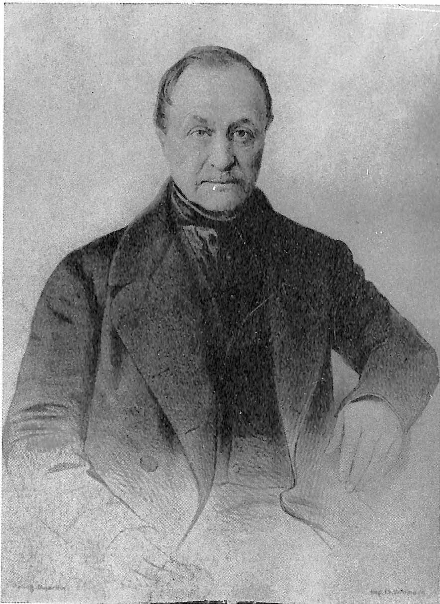
AUGUSTO COMTE Fundador de la Sociología