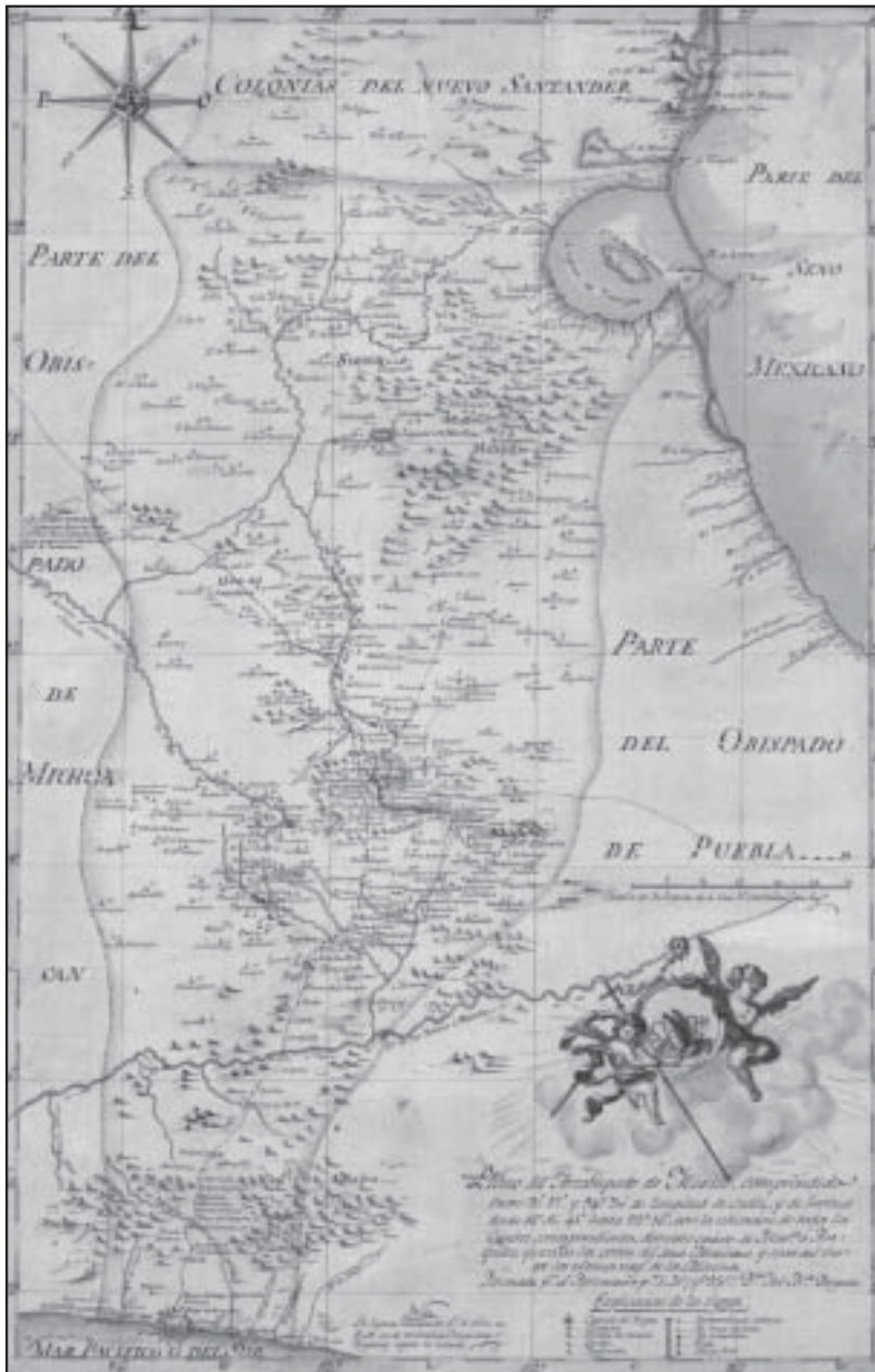
Plano del Arzobispado de México, por José María Delgado, s/f (finales del siglo XVIII). Escala: gráfica. Medidas: 62 x 43 cm. Colección Orozco y Berra, México, Varilla OYBMEX01, 1163-OYB-7251-A, papel marca manuscrito coloreado. Mapoteca Manuel Orozco y Berra, Servicio de Información Agroalimentaria y Pesquera, SAGARPA.