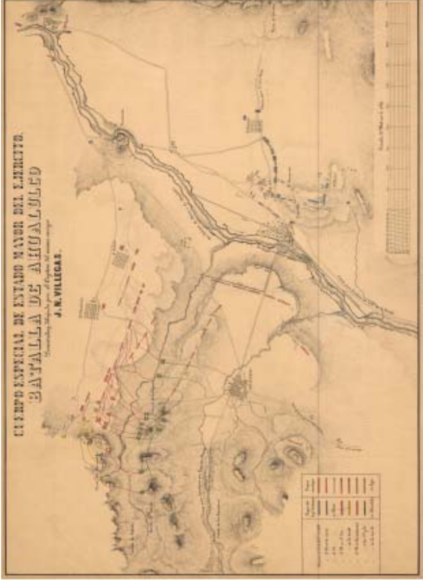
Cuerpo Especial del Estado Mayor del Ejército. Batalla de Ahualulco, por J. N. Villegas, 1858. Escala: 1:20 000. Medidas: 52 x 77 cm. Colección Orozco y Berra, Jalisco, Varilla OYBAL01, 1347-OYB-7233-A, litografía en papel común. Mapoteca Manuel Orozco y Berra, Servicio de Información Agroalimentaria y Pesquera, SAGARPA.