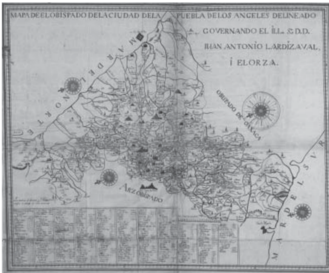
Mapa del Obispado de la ciudad de Puebla de los Ángeles. Autor desconocido, 1773. Escala: en leguas, medidas: 113 × 130 cm. Colección Orozco y Berra, Guanajuato, Varilla OYBPUE02, 1152-OYB-7247-A, tela calca, manuscrito a colores, coloreada. Mapoteca Manuel Orozco y Berra, Servicio de Información Agroalimentaria y Pesquera, SAGARPA.