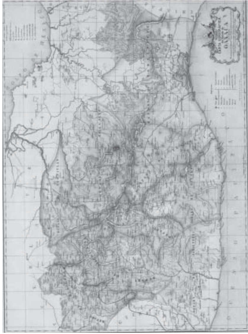
Carta corográfica del estado de Oaxaca y de su Obispado, por Manuel Ortega Reyes, 1857. Escala: 500 m. Medidas: 64 x 74 cm. Colección Orozco y Berra, Oaxaca, Várilla OYBOAX02, 1733-OYB-7252-A, litografía. Mapoteca Manuel Orozco y Berra, Servicio de Información Agroalimentaria y Pesquera, SAGARPA.