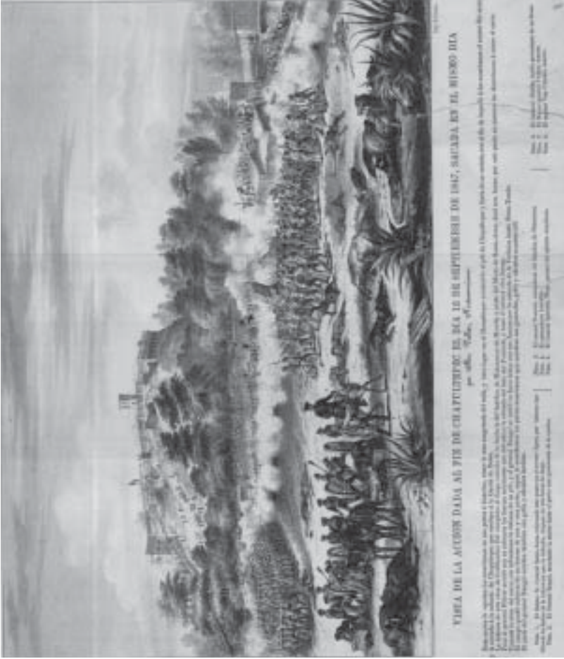
Vista de la acción dada al pie de Chapultepec el día 13 de septiembre de 1847, sacada en el mismo día por Mr. Valker, norteamericano. Medidas: 40 x 52 cm. Colección Orozco y Berra, Distrito Federal, Varilla OYBDF09, 2442-OYB-725-A, litografía. Mapoteca Manuel Orozco y Berra, Servicio de Información Agroalimentaria y Pesquera, SAGARPA.