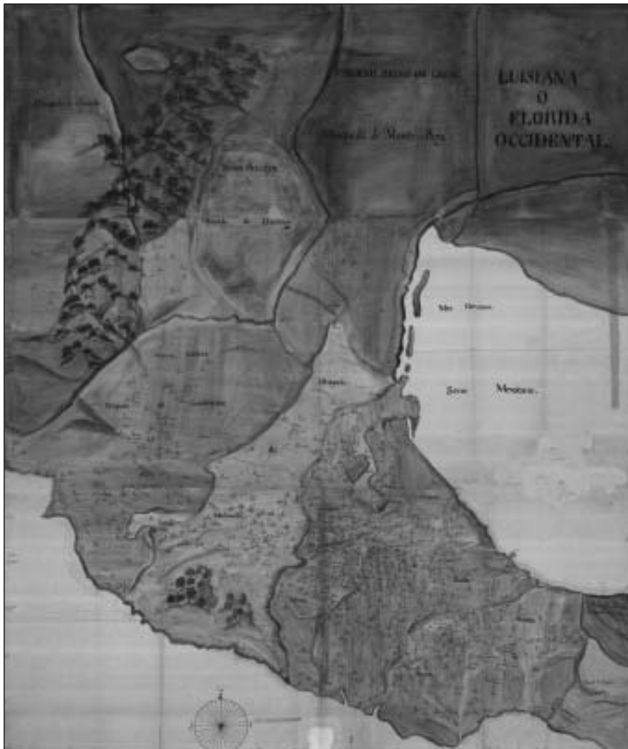
Plano de las jurisdicciones de los obispados de la República Mexicana, autor desconocido, sin fecha. Escala: medidas: 92 x 215 cm. Colección Orozco y Berra, República Mexicana, Varilla OYBRM03, 1153-OYB-O-A-2, tela calca, manuscrito acuarelado. Mapoteca Manuel Orozco y Berra, Servicio de Información Agroalimentaria y Pesquera, SAGARPA.