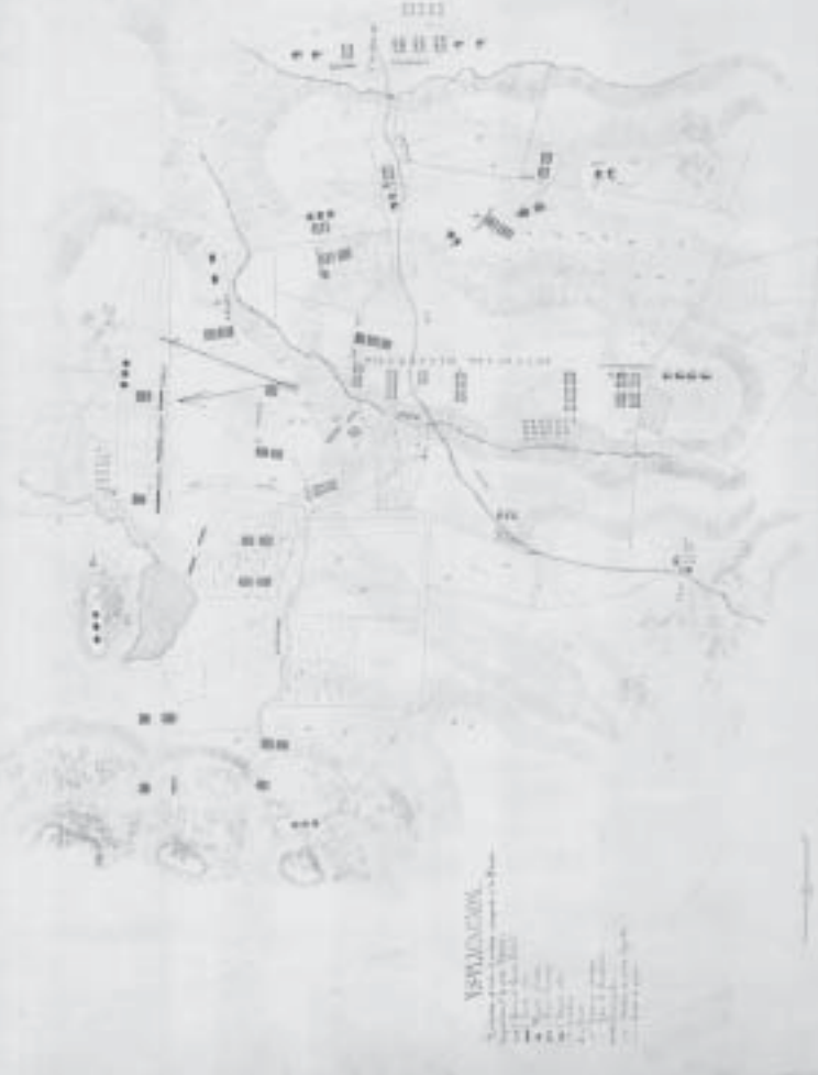
Croquis de la batalla ganada por el ejército federal a las tropas reaccionarias de México en las Lomas de Calpulalpam, el 22 de diciembre de 1860, por Cuerpo Nacional de Ingenieros, Ejército Federal, 1847. Escala: gráfica. Medidas: 52 x 63 cm. Colección Orozco y Berra, México, Varilla OYBMEX02, 1354-OYB-7251-A, papel marca manuscrito coloreado. Mapoteca Manuel Orozco y Berra, Servicio de Información Agroalimentaria y Pesquera, SAGARPA.