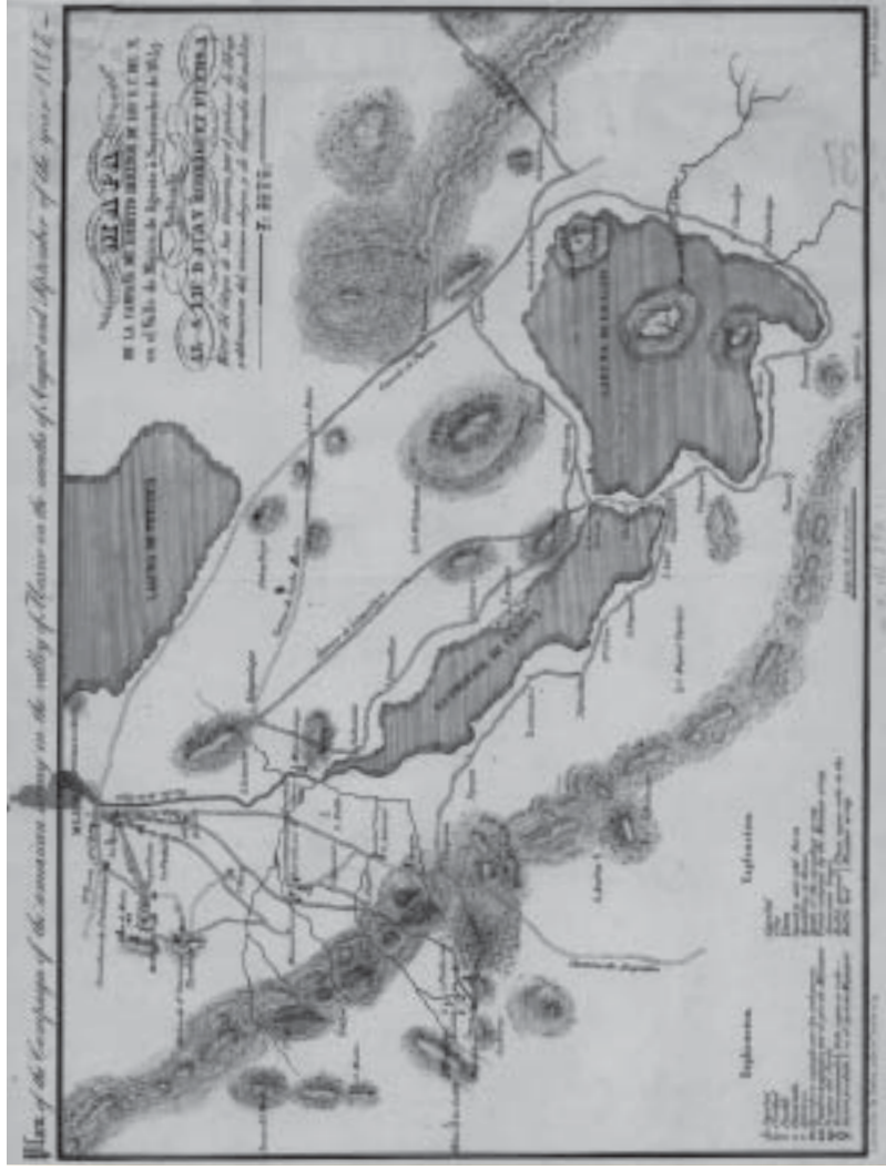
Plan of the Campaign of the American Army in the Valley of Mexico in the Months of August and September of the Year 1847, por F. Soto, 1847. Escala: 13 700. Medidas: 32 x 41 cm. Colección Orozco y Berra, Distrito Federal, Varilla OYBDF04, 1337-OYB-725-A, litografía. Mapoteca Manuel Orozco y Berra. Servicio de Información Agroalimentaria y Pesquera. SAGARPA.