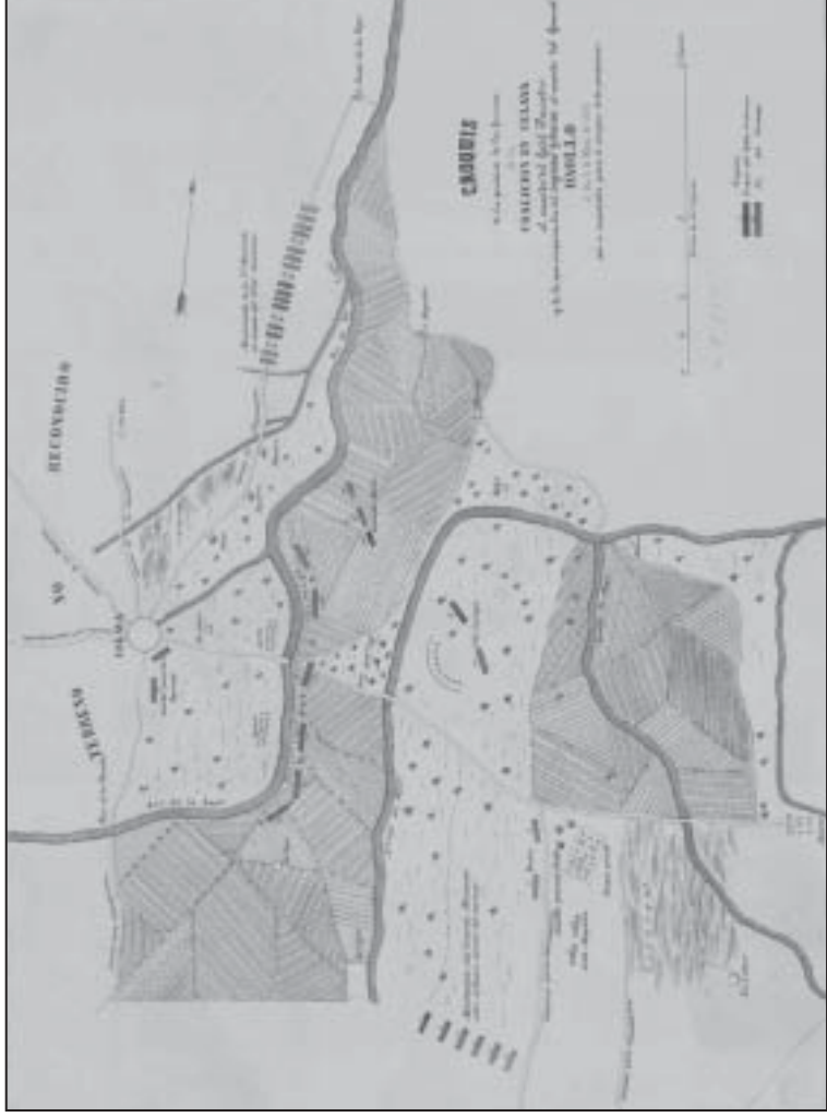
Croquis de la posición de las fuerzas de la coalición en Celaya al mando del Gral. Parrodi y de las que ocuparon las del supremo gobierno al mando del Gral. Osollo el día 7 de marzo de 1858, autor desconocido. Escala: 1: 8,297, medidas: 36 x 45 cm. Colección Orozco y Berra, Guanajuato, Varilla OYBG-T001, 1356-OYB-7244-A, litografía en papel común. Mapoteca Manuel Orozco y Berra, Servicio de Información Agroalimentaria y Pesquera, SAGARPA.