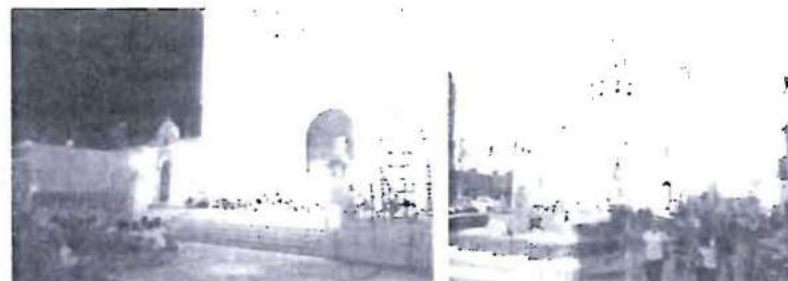
FIGURA 1 LOS CENTROS HISTÓRICOS, PRINCIPALES CONTENEDORES DE LAS DINÁMICAS DE COHESIÓN SOCIAL.

nómicos y sociales propios de la ciudad, genera una tensión entre la gran riqueza histórico-cultural y la pobreza social-económica acumulada, la cual termina por materializarse en un desequilibrio urbano, que ocasiona la erosión y pauperización del conjunto central citadino. iv) Reducción de la accesibilidad -principalmente vial- y las posibilidades de articulación con el resto del organismo urbano, interfiriendo con la capacidad que ofrecen los centros fundacionales para acoger y estimular el desarrollo de todas las dinámicas urbanas sociales, económicas, administrativas. V) Inadecuadas políticas urbanas que administran, regulan y "protegen" los centros históricos; políticas que varían entre la tendencia rígida "monumentalista" y su defensa a ultranza del patrimonio físico, y las tendencias "desarrollistas" que entienden los centros a partir del valor económico del suelo, devastando los valores heredados del pasado y estimulando procesos como la gentrificación y la pérdida de identidad (Carrión, 2010: 19-25).