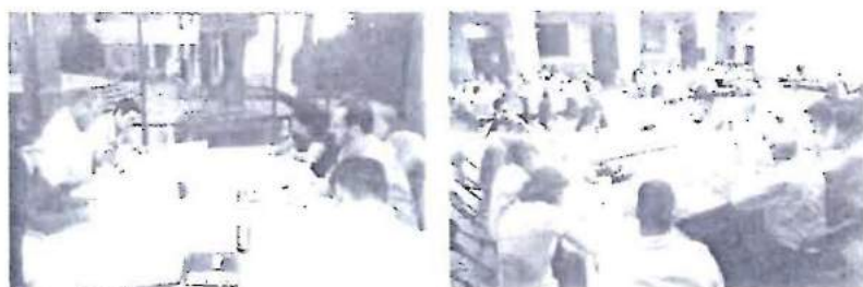
FIGURA 3 CARTOGRAFÍA PARTICIPATIVA.

ya a representantes de las organizaciones no gubernamentales que participan en dichas políticas sectoriales. En los talleres territoriales se convoca a los vecinos de las diferentes zonas para que expongan la problemática que ellos viven. En ambos tipos de taller se trabaja con fichas y con mapas. Las técnicas de cartografía participativa permiten recolectar información valiosa que complementa lo que los participantes expresan en las fichas de diagnóstico y propuestas. Los resultados de los talleres son sistematizados por el equipo del PUEC-UNAM para integrar las aportaciones de funcionarios, académicos, líderes de organizaciones sociales y vecinos.