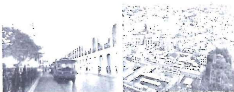
FIGURA 5 CENTROS HISTÓRICOS DE CAMPECHE, GUANAJUATO Y ZACATECAS.